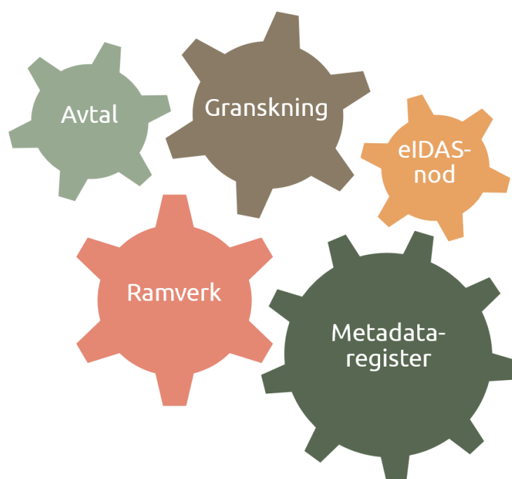
Figur 1: DIGG:s digitala infrastruktur för e-legitimering och e-underskrift

Identitetsfederation 31 är ett samlingsbegrepp för metadataregister 32 och regler som stödjer säker elektronisk identifiering av användare. DIGG:s huvudsakliga områden kan sammanfattas i följande bild: